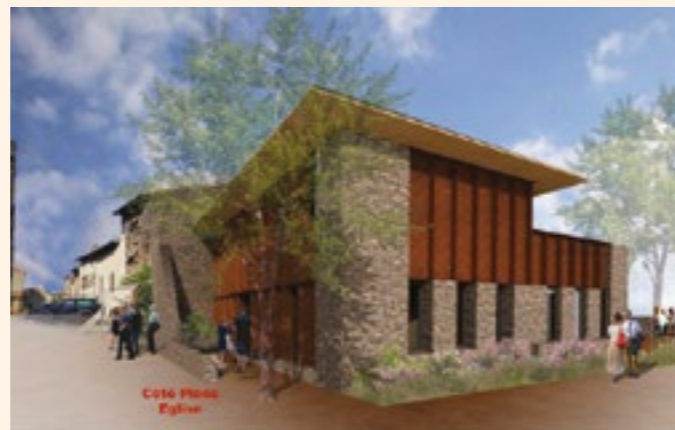
Côté Place Eglise