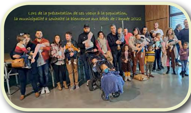
Lors de la présentation de ses vœux à la population, la municipalité a souhaité la bienvenue aux bébés de l'année 2022